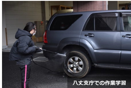
八丈支庁での作業学習