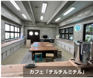
カフェ「チルチルミチル」

作業学習では、作業活動を学習の中心にしなが ら、生徒の働く意欲を培い、将来の職業生活や 社会自立に必要な事柄を総合的に学習します。