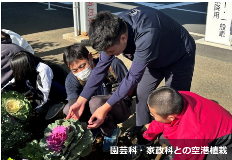
園芸科・家政科との空港植栽