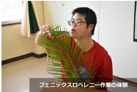
フェニックスロベニー作業の体験