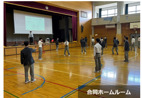
合同ホームルーム

八丈分教室では、体育祭、文化祭や宿泊行事等を都立八丈高等学校と合同で実施しています。また、学年ホームルーム等、一部の授業を合同で授業を行う場合もあります。小・中学校から共に育った環境を大切にしていきます。（標準服は都立八丈高等学校と同仕様です）