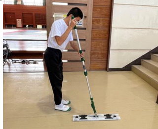
[清掃]ダスタークロス清掃

卒業後の就労に向け、清掃・事務・食品加工の各作業では、仕事をする上での基本的なマナーや技術の習得を目指し、学習に取り組んでいます。