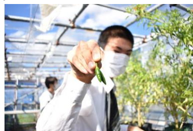
[食品加工]園芸科での島とうり収穫